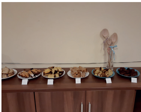
Soutěž o nejlepší bábovku, 23. 11. 2019