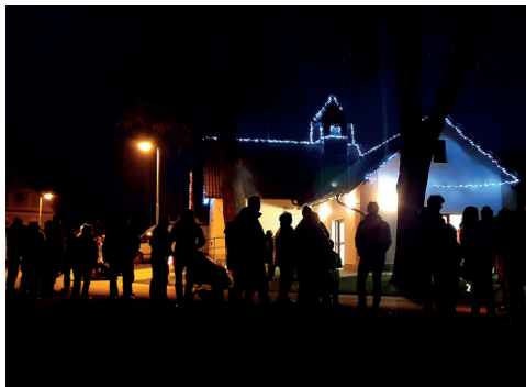
Lhota u Nahořan - Doubravice