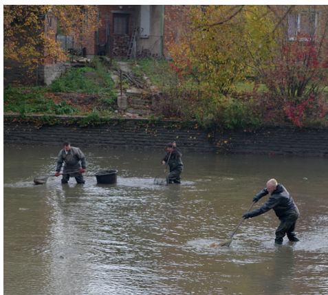
Výlov rybníka, 19. 10. 2019