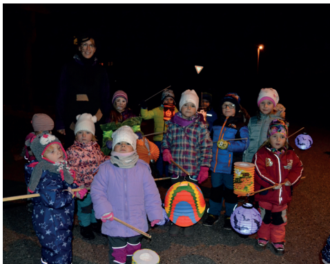
Halloweenská stezka, 1. 11. 2019