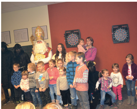
Mikulášská nadílka, 6. 12. 2019