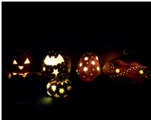
Dýňování, 28. 10. 2019