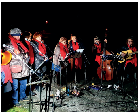
Nahořany - vystoupení Pěnice