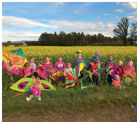
Drakiáda, 29. 9. 2019