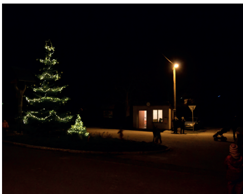
Rozsvícení vánočního stromu, 1. 12. 2019